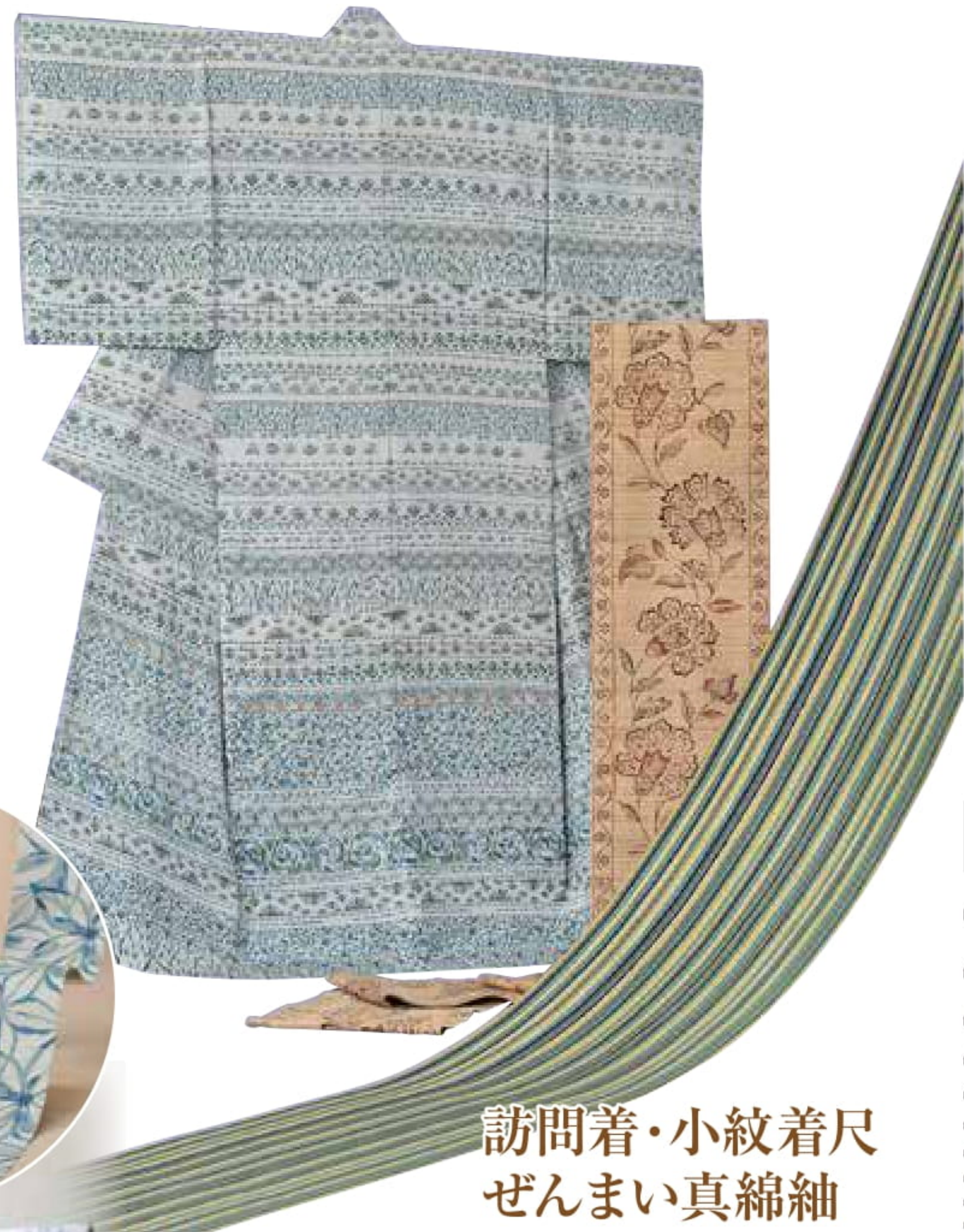
訪問着・小紋着尺 ぜんまい真綿紬 自然から生まれる素朴な味わい

和布工房は、きものを着て楽しむ「真のきものファン」を増やすために素材から染色まで「完全オリジナル」にこだわった物づくりをしています。